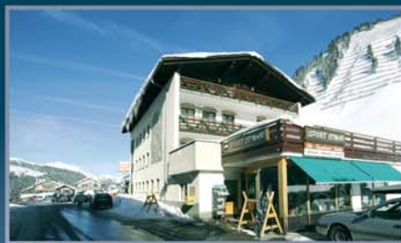
Schneevergnügen pur bei uns im Winter!

Geschäft im Haus mit Souvenirs, Sportartikeln, Skiverleih, uvm.