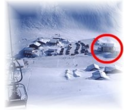
Lage des Rössle im Winter

Preise Halbpension pro Tag und Person inkl. Kurtaxe (Stand 1.08.2010)